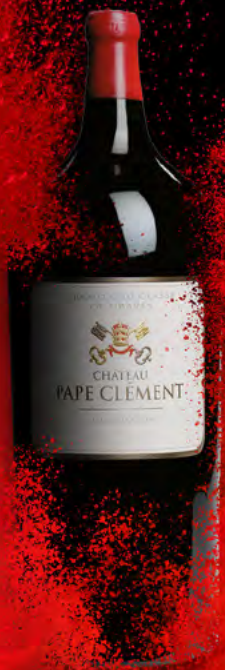
Salmanazar 9 litros