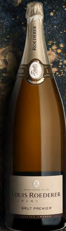
Nabuchodonosor 15 litros 20 botellas