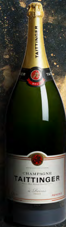
Balthazar 12 litros 16 botellas