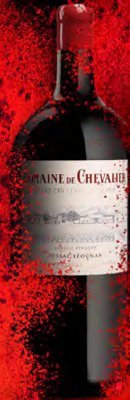
Jéroboam 5 litros