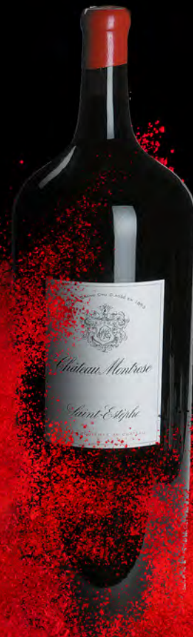
Melchior 18 litros