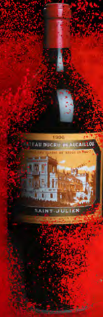
Impériale 6 litros