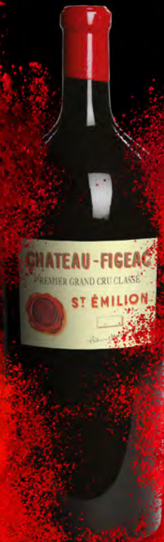
Balthazar 12 litros