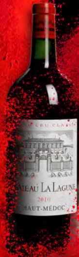
Doble mágnium 3 litros