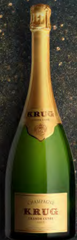
Jéroboam 3 litros 4 botellas

Estos grandes formatos están disponibles en cantidad limitada.