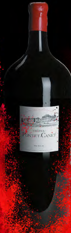
Nabuchodonosor 15 litros