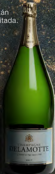
Mathusalem 6 litros 8 botellas