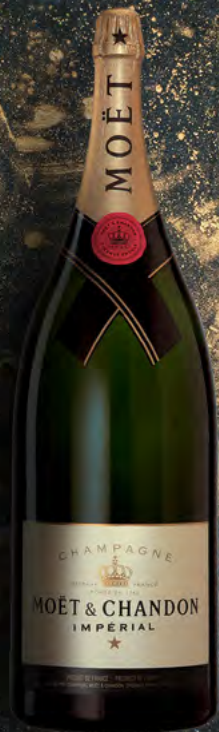
Salmanazar 9 litros 12 botellas