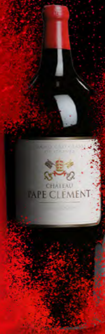
Salmanazar 9 litres