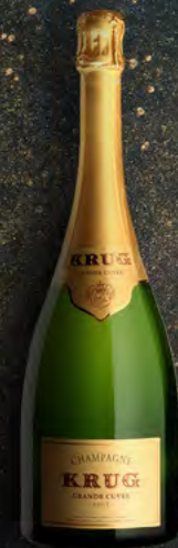
Jeroboam 3 litres

These large formats are available in very limited quantities.