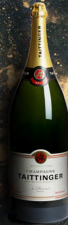
Balthazar 12 litres