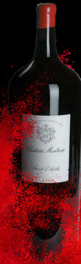
Melchior 18 litres