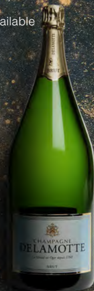
Mathusalem 6 litres