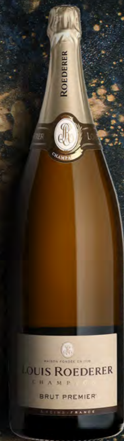
Nebuchadnezzar 15 litres