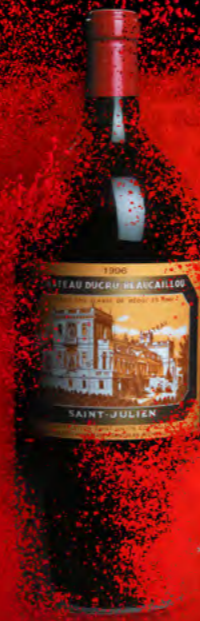
Impériale 6 litres