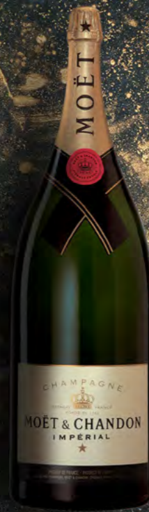
Salmanazar 9 litres