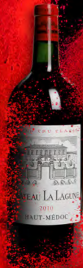
Double-magnum 3 litres