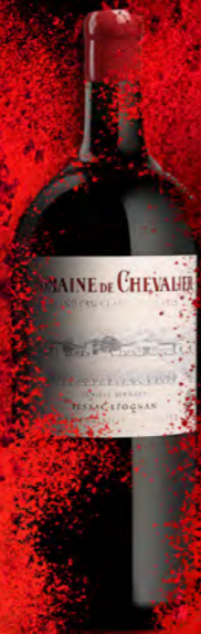
Jeroboam 5 litres