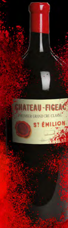
Balthazar 12 litres