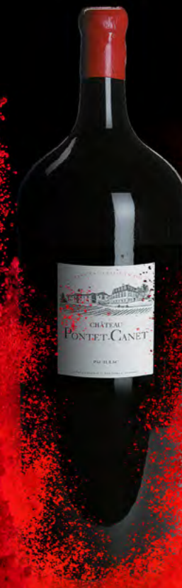
Nebuchadnezzar 15 litres