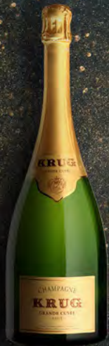
Jéroboam 3 Liter 4 Flaschen

Die Grossflaschen sind nur in sehr begrenzten Mengen verfügbar.