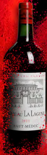
Doppel-Magnum 3 Liter