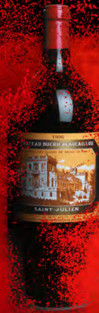
Impériale 6 Liter