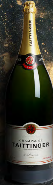
Balthazar 12 Liter 16 Flaschen