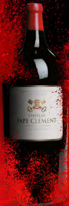
Salmanazar 9 Liter