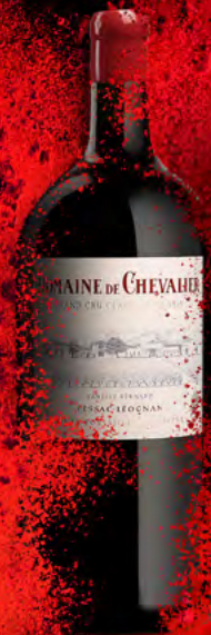
Jéroboam 5 Liter