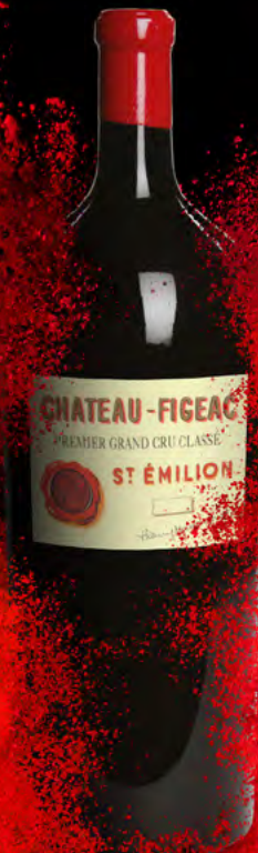
Balthazar 12 Liter