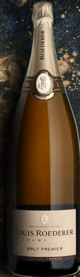
Nabuchodonosor 15 Liter 20 Flaschen