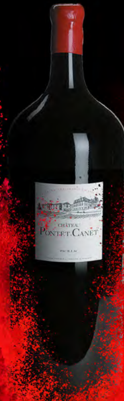
Nabuchodonosor 15 Liter