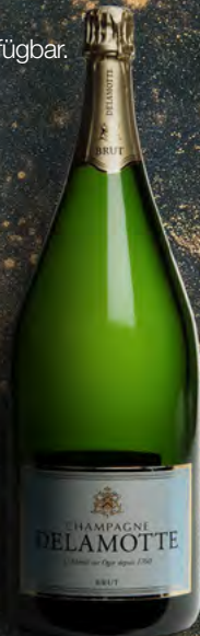
Mathusalem 6 Liter 8 Flaschen