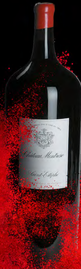
Melchior 18 Liter