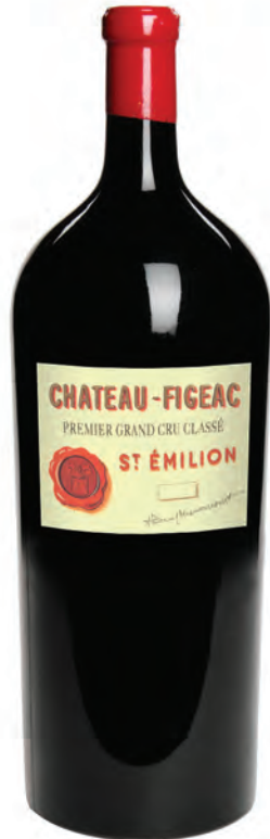
Balthazar 12 Liter