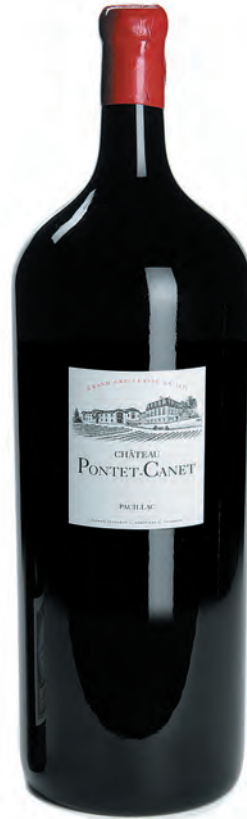
Nabuchodonosor 15 Liter