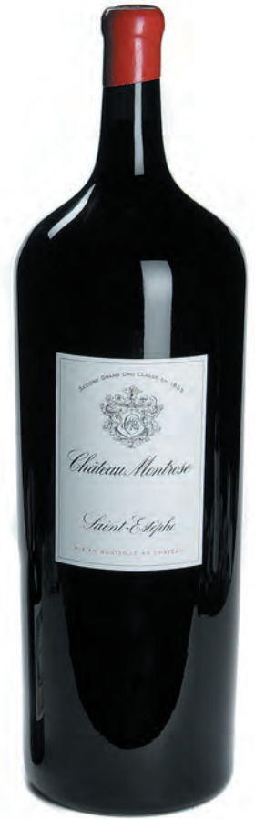
Melchior 18 Liter