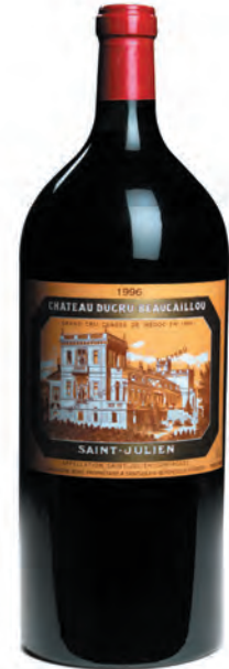
Imperiale 6 litres