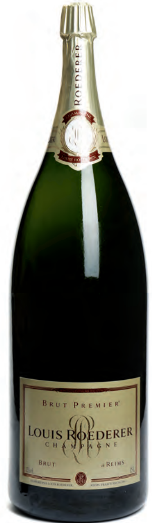
Nebuchadnezzar 15 litres