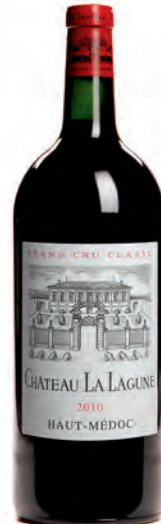
Double-magnum 3 litres