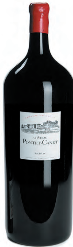
Nebuchadnezzar 15 litres