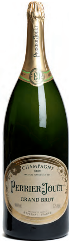
Salmanazar 9 litres