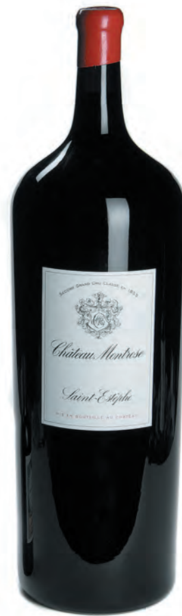
Melchior 18 litres