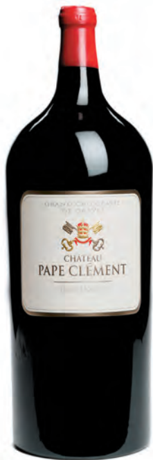
Salmanazar 9 litres