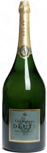
Mathusalem 6 litres

These large formats are available in very limited quantities.