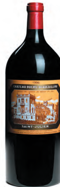
Imperiale 6 litres