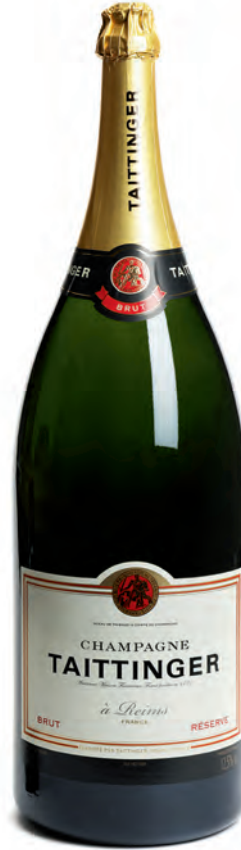
Balthazar 12 litres