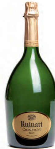
Jeroboam 3 litres