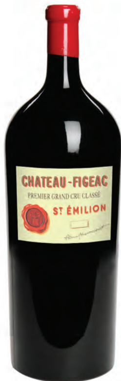
Balthazar 12 litres