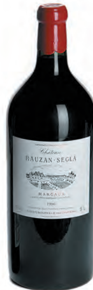
Jeroboam 5 litres