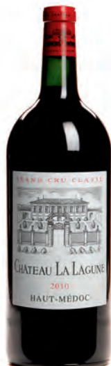
Double-magnum 3 litres