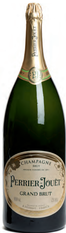
Salmanazar 9 litros