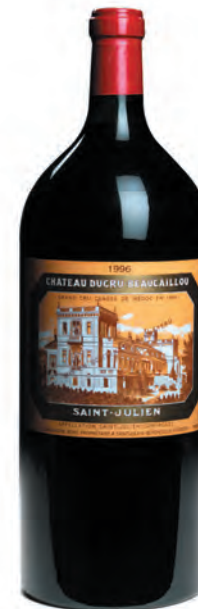
Impériale 6 litros