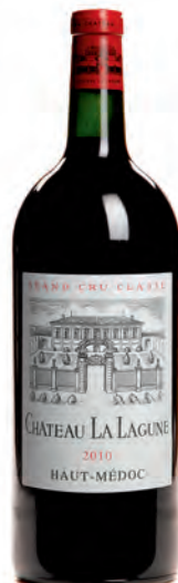
Duplo-magnum 3 litros