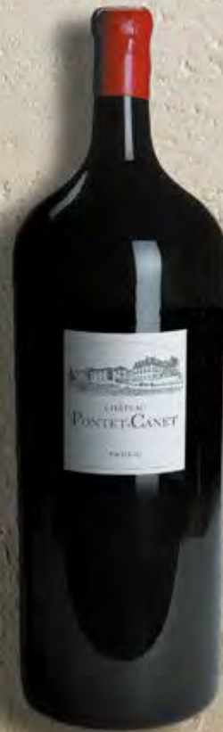
Nabuchodonosor 15 Liter