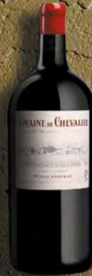
Jéroboam 5 Liter