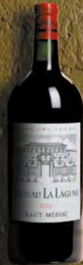
Doppel-Magnum 3 Liter