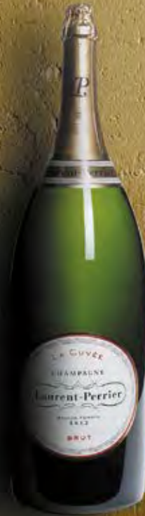
Salmanazar 9 Liter 12 Flaschen