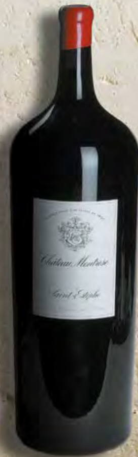
Melchior 18 Liter