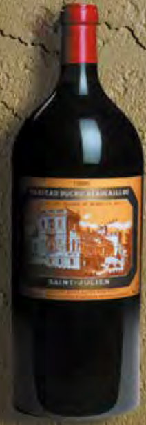
Impériale 6 Liter