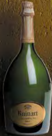
Jéroboam 3 Liter 4 Flaschen

Die Grossflaschen sind nur in sehr begrenzten Mengen verfügbar.