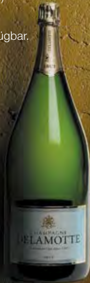
Mathusalem 6 Liter 8 Flaschen