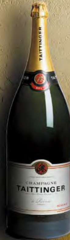
Balthazar 12 Liter 16 Flaschen