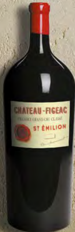
Balthazar 12 Liter