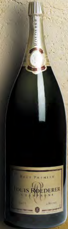
Nabuchodonosor 15 Liter 20 Flaschen