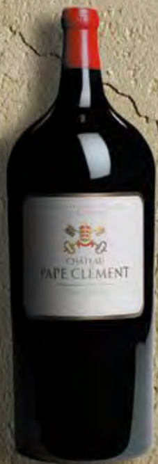
Salmanazar 9 Liter