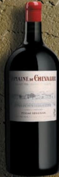
Jeroboam 5 litres