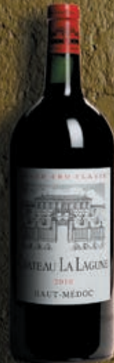
Double-magnum 3 litres