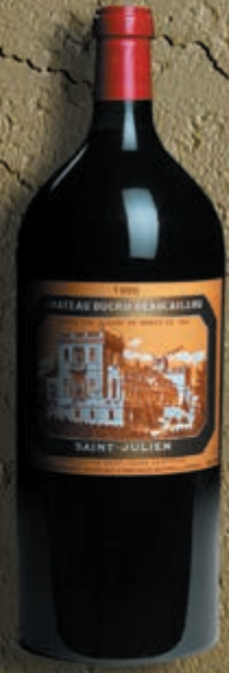
Impériale 6 litres