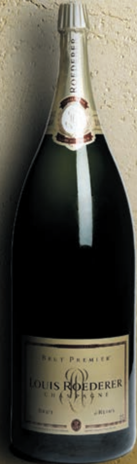
Nebuchadnezzar 15 litres