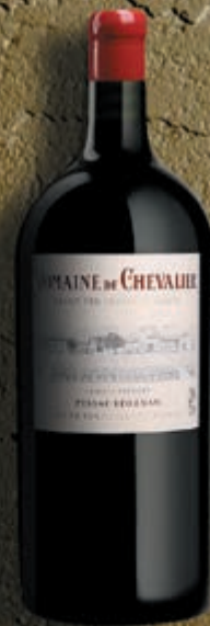
Jeroboam 5 litres