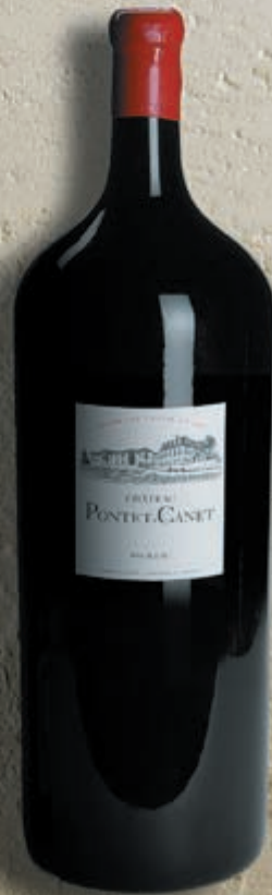
Nebuchadnezzar 15 litres