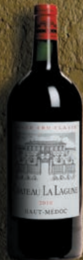
Double-magnum 3 litres