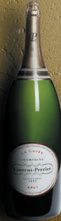
Salmanazar 9 litres