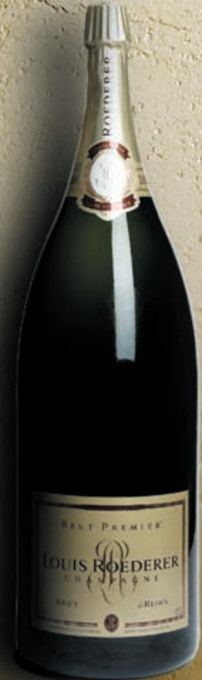
Nebuchadnezzar 15 litres