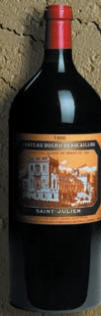
Imperiale 6 litres