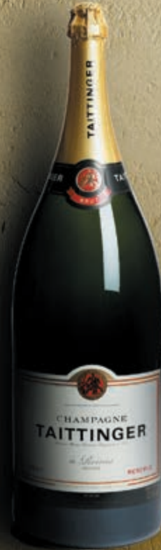
Balthazar 12 litres