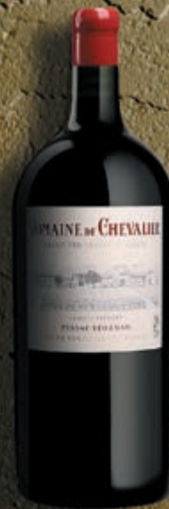
Jéroboam 5 litros