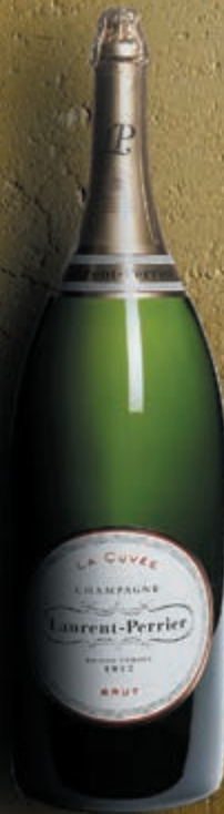
Salmanazar 9 litros