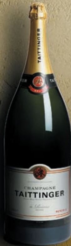
Balthazar 12 litri