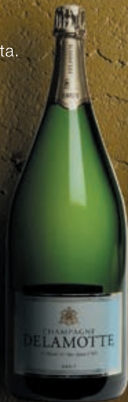
Mathusalem 6 litri