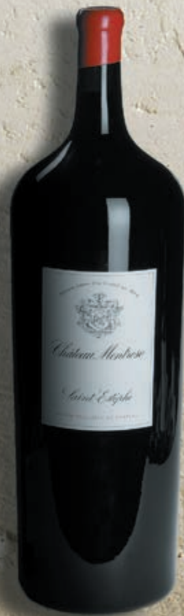
Melchior 18 litri