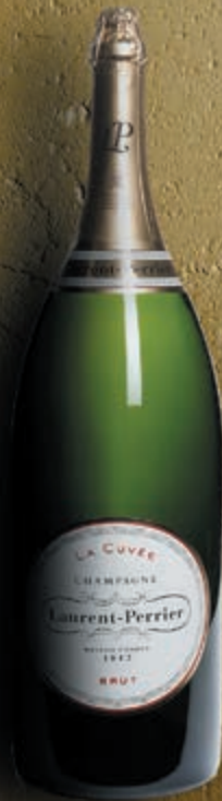
Salmanazar 9 litri