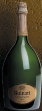
Jéroboam 3 litri

Questi grandi formati sono disponibili in quantità limitata.