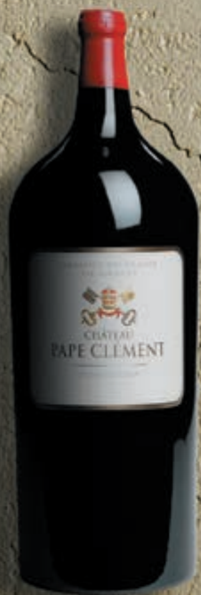
Salmanazar 9 litri