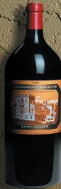
Mezza bottiglia 0,375 litro