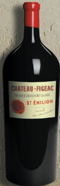
Balthazar 12 litri